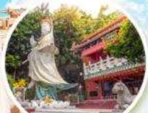
เจ้าแม่กวนอิม ริพลัสเบย์