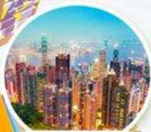
จุดชมวิว วิคตอเรียพีค